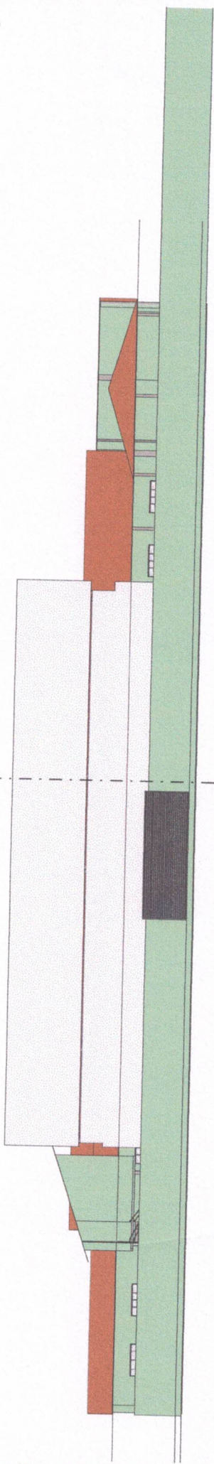
1 FACHADA POSTERIOR Escala: 1 : 100