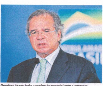
Guedes: jovem teria um vínculo especial com a empresa

O plano do ministro Paulo Guedes (Economia) de conceder um pagamento aos jovens que não estudam e não trabalham (os chamados "nem-nem") para incentivar a qualificação profissional prevê uma quantia a ser arcada por empresas. Com isso, o valor recebido pela pessoa pode chegar a R$ 600.