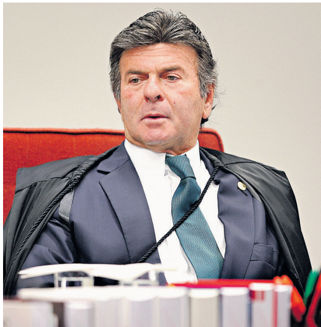
O ministro Luiz Fux contestou o objetivo da ação

A Câmara afirmou ao STF que “o transporte individual remunerado de passageiros é atividade de interesse público e, por isso, sujeita a restrições nas livres iniciativa e concorrência”. Argumentou também que um serviço