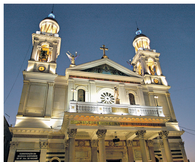
Igrejas serão beneficiadas com isenção de ICMS

Com o projeto aprovado nesta quarta, as igrejas ganham tratamento equivalente ao do setor industrial, o mais sensível a mudanças tributárias e, por isso, o que recebeu o maior prazo de adaptação.